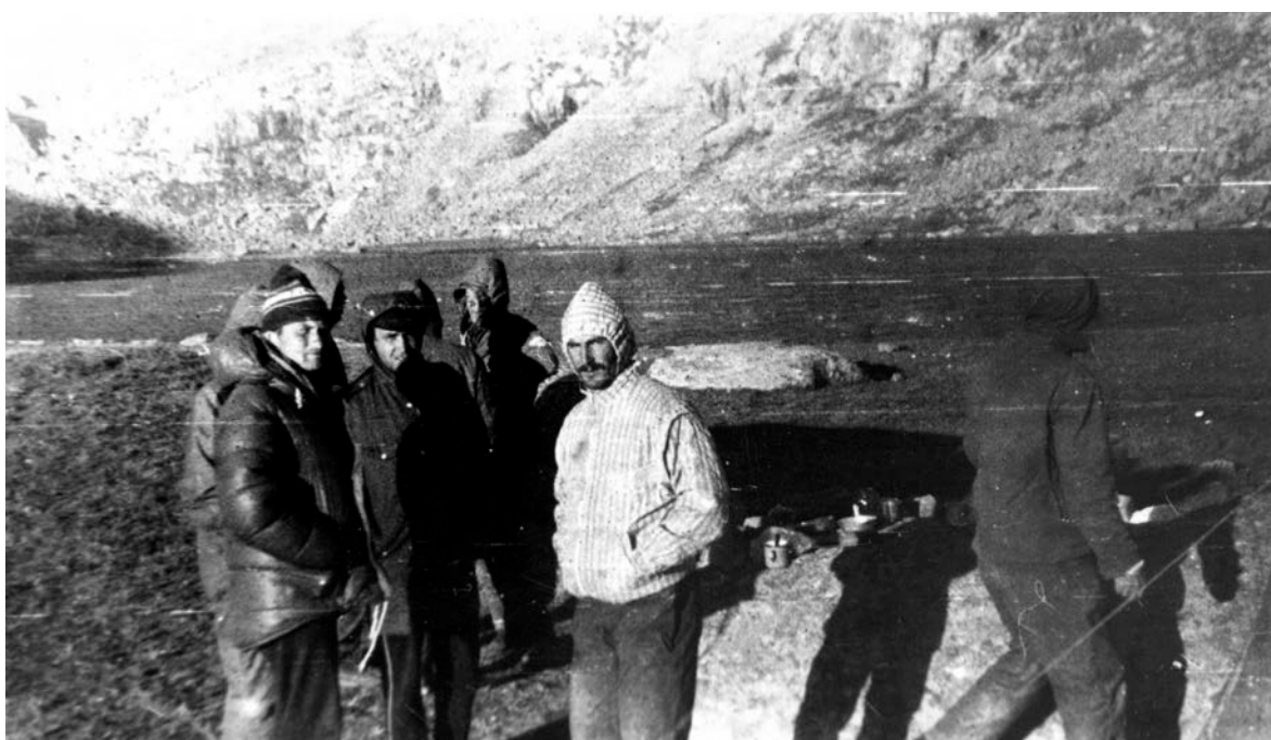
Фото №6 Холодно в «Долине озёр»

Погода стояла ветреная. Приятно светило солнце, но было холодно. Особенно, когда солнце пряталось за тучку. Стоило только солнцу совсем спрятаться за гору, как ветер сразу стих, но стало ещё холоднее.