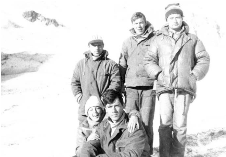
Фото №4 На стоянке

Завтрак дежурные варили на костре. Но принесённых с собой дров оставалось всё меньше и меньше. Оставшиеся от готовки дрова перераспределил среди мужиков, чтобы нести их дальше для приготовления ужина.