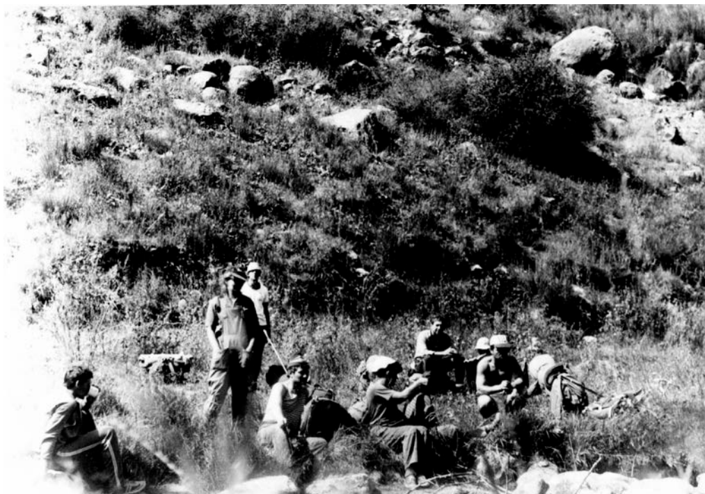
Фото №12 Жара на берегу Тамгинки

Неторопливо и лениво собрали свои вещи и сняли лагерь. По крутой лесной тропе вышли на заливные луга с пасущимися коровами и овцами. Далее продолжили спуск уже по крутой лесной дороге до переправы через правый приток реки Тамгинки 18 . Там сделали привал. Народ начал спешно раздеваться. Сначала в рюкзак полетели штормовые костюмы. Потом – свитера и тёплые штаны. Наступало вернувшееся и уже никем нежданное лето.