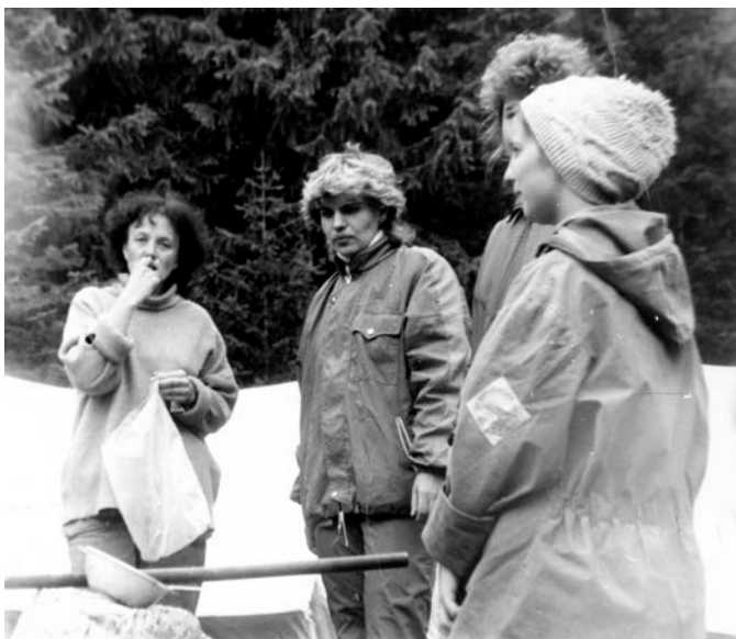
Фото №12 Наш «женсовет»

Неторопливо и лениво собрали свои вещи и сняли лагерь. По крутой лесной тропе вышли на заливные луга с пасущимися коровами и овцами. Далее продолжили спуск уже по крутой лесной дороге до переправы через правый приток реки Тамгинки 18 . Там сделали привал. Народ начал спешно раздеваться. Сначала в рюкзак полетели штормовые костюмы. Потом – свитера и тёплые штаны. Наступало вернувшееся и уже никем нежданное лето.