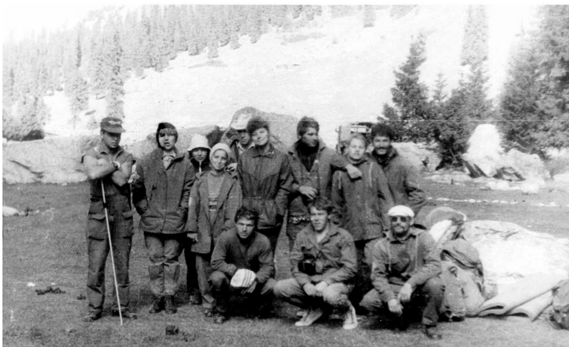
Фото №1 После экскурсии на «Поляне слётов»

Возвращались с хорошим настроением. Народу экскурсия понравилась. И дорога на поляну проходила то по еловому лесу, то по живописному берегу реки.