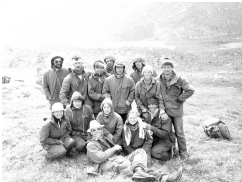
Фото №5 На перевале Альпийских Роз

На перевал Альпийских Роз (Джан-Коргон) 8 1А, 3740 метров над у.м. вышли в предобеденное время. Перевал представлял собой широкую седловину и являлся типичный скотопрогоном. Его категория сложности была явно завышена. По другую сторону перевала были видны озёра в долине Уч-Эмчека 9 и горная гряда с серией снежных вершин 10